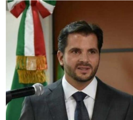
Rafael Pacchiano Alamán titular de la SEMARNAT